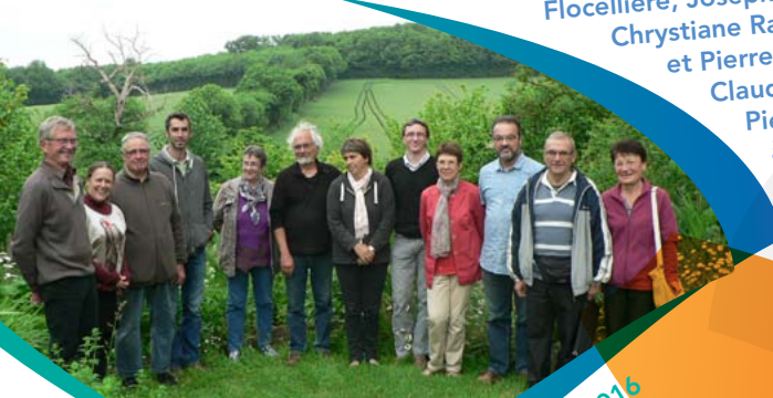
Les jardiniers 2016